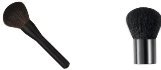
Photos du gros pinceau boule et du gros kabuki rond