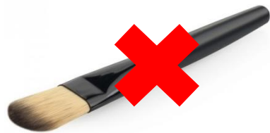
Photo du pinceau plat barrée